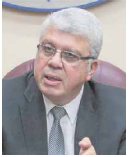
د. أيمن عاشور

في المرحلة الثانية إلى أكثر من ٢٥٢ ألف طالب وطالبة. وأضاف الوزير أن المرحلة الثانية بها أماكن شاغرة في كليات الطب البيطري والتمريض والعلوم والزراعة والحاسبات والمعلومات والذكاء الاصطناعي إلى جانب غالبية كليات الشبكات الأدبية مثل التربية والآداب والحقوق والتربية النوعية.